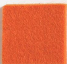
Orange 6912 415