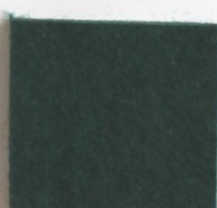
Vert 6906 1609