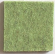
Vert Pomme 1872