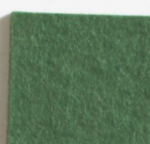
Epinard 6893 1613