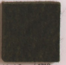
Vert Foncé 1710