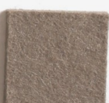
Beige 6910 534