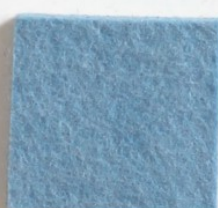
Bleu ciel 6742 446