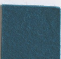
Bleu de Prussie 6902 1615