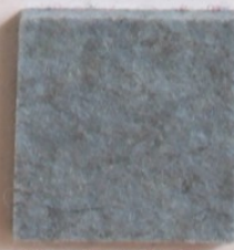
Bleu Clair 1265