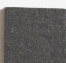
Anthracite 6908 1593