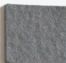
Gris 6907 554