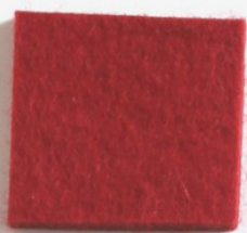
Bordeaux 6915 1610