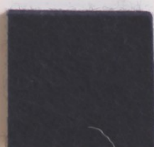
Bleu Foncé 6904 1611