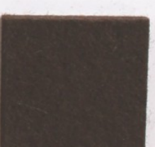
Marron 6872 539