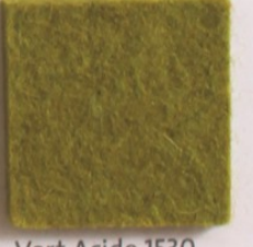
Vert Acide 1530