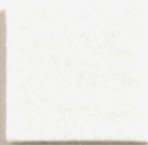
Blanc 456 456