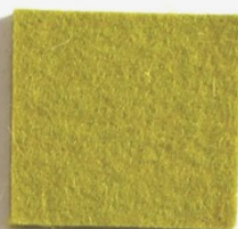
Vert Acide 6905 1530