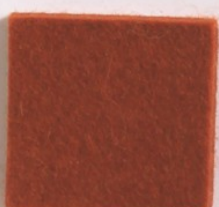
Rouge Brique 6913 636