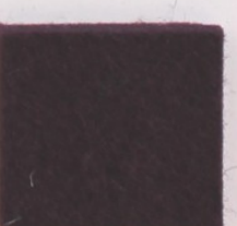
Prune 6909 1612