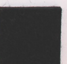
Noir 4041 657