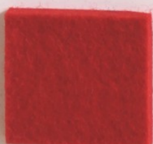
Rouge 6914 519