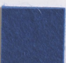
Bleu Royal 6903 549